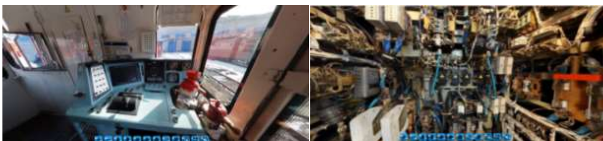
Рисунок № 2. Виртуальная экскурсия. Кабина управления, высоковольтная камера тепловоза

Разработанная виртуальная экскурсия позволяет посетить все отсеки и помещения тепловоза серии ТЭМ18ДМ, ознакомиться, увеличить и подробно рассмотреть оборудование, находящееся на тепловозе.