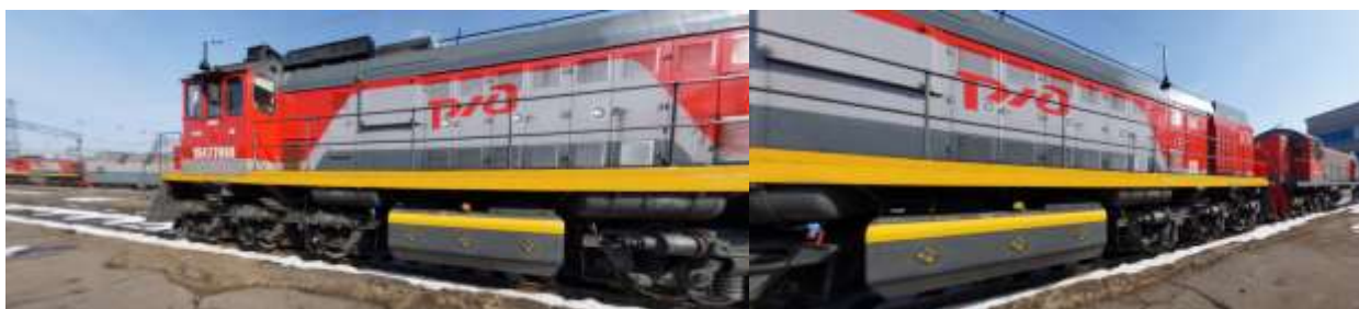
Рисунок № 1. Виртуальная экскурсия. Тепловоз ТЭМ18ДМ

Для осуществления плавного перехода от теоретических знаний об устройстве тепловоза, особенно его электрической части, к практическому пониманию – как эти приборы и аппараты выглядят в реальности и в каких местах размещаются была разработана виртуальная экскурсия по тепловозу серии ТЭМ18ДМ (Рис. 1-2). Для того чтобы разработать качественную виртуальную экскурсию необходимо сделать фотографии выбранного объекта высокого качества, для этого используется зеркальный фотоаппарат с широкоугольным объективом, специальной панорамной головкой, позволяющей вращать фотоаппарат в одной (нодальной) точке. Полученные фотографии объединяются и обрабатываются в специальных программах.