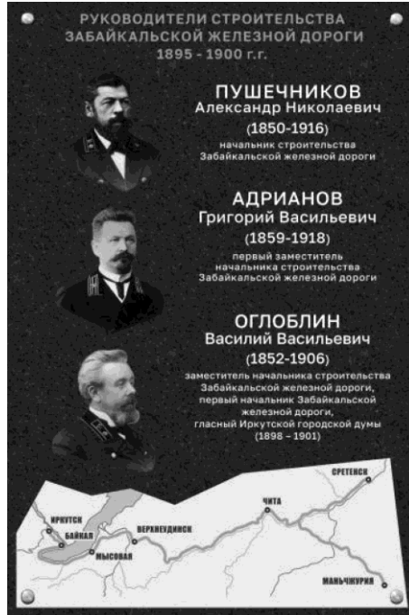
Рис. 10. Проект мемориальной доски инженерам-строителям Забайкальской железной дороги в Иркутске