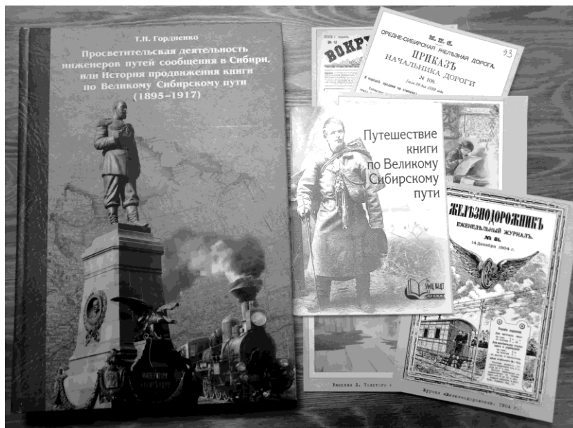
Рис. 1. Книга Т. Н. Гордиенко и набор открыток. ФГБУ ДПО «УМЦ ЖДТ»

помощником, другом и духовным врачом людей являлось печатное слово, которое несло в массы культуру и просвещение. Поэтому одним из первых просветительских учреждений на Транссибе стали библиотеки – читальни, возникшие прямо на строительных участках» [2].