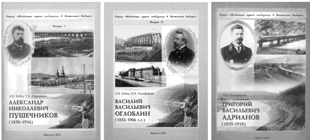
Рис. 3. Книги серии «Инженеры путей сообщения в Восточной Сибири»