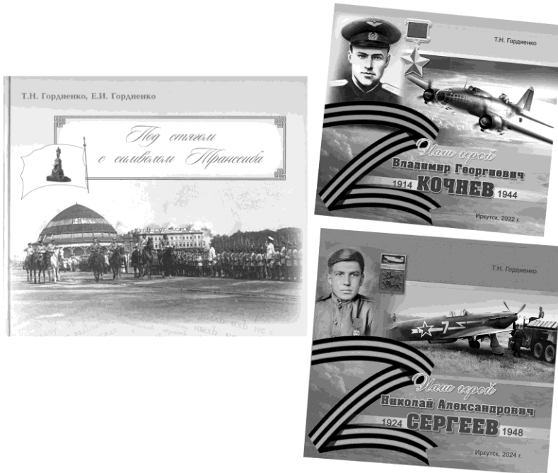
Рис. 5. Книги серии «Растим патриотов России»

венной войне, получил название «Растим патриотов России» и также успешно вошел в жизнь в 2018 г. (рис. 5) [20].