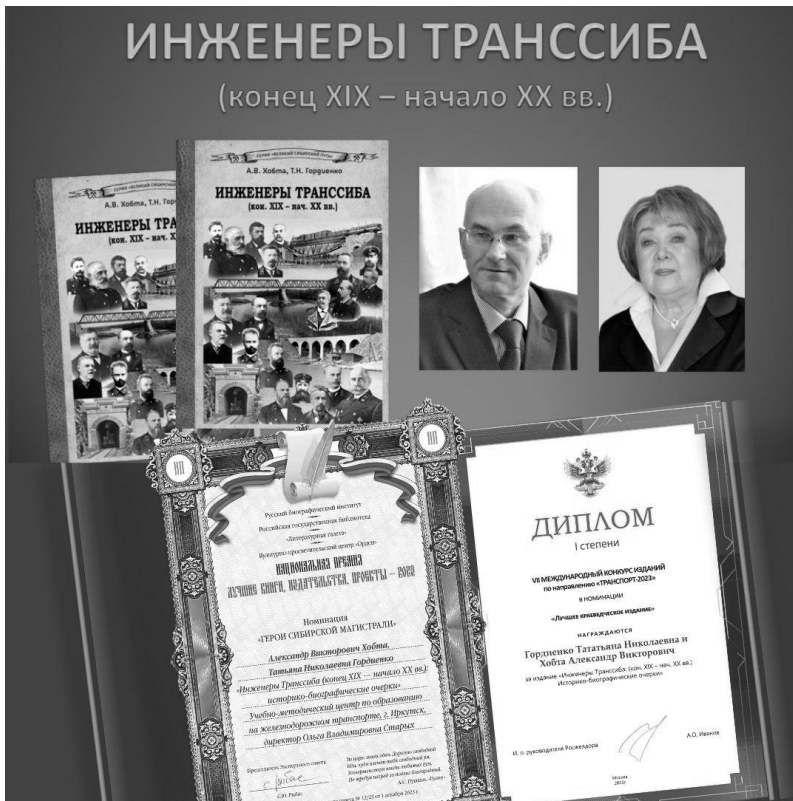
Рис. 4. Награды за книгу «Инженеры Транссиба» (2023)