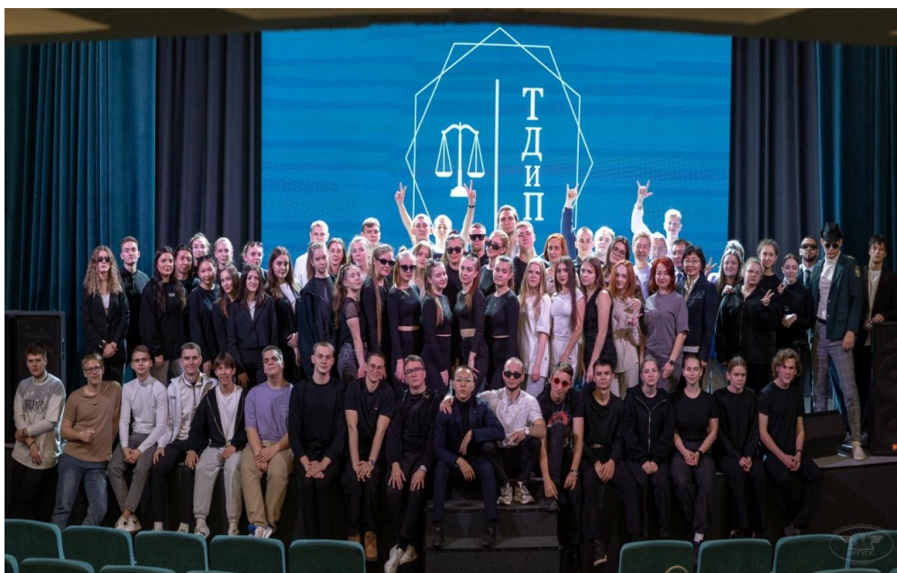
Рис. 11. Преподаватели и студенты факультета экономики и управления на праздновании 20-летия со дня открытия специальности «Таможенное дело». 2024 г.