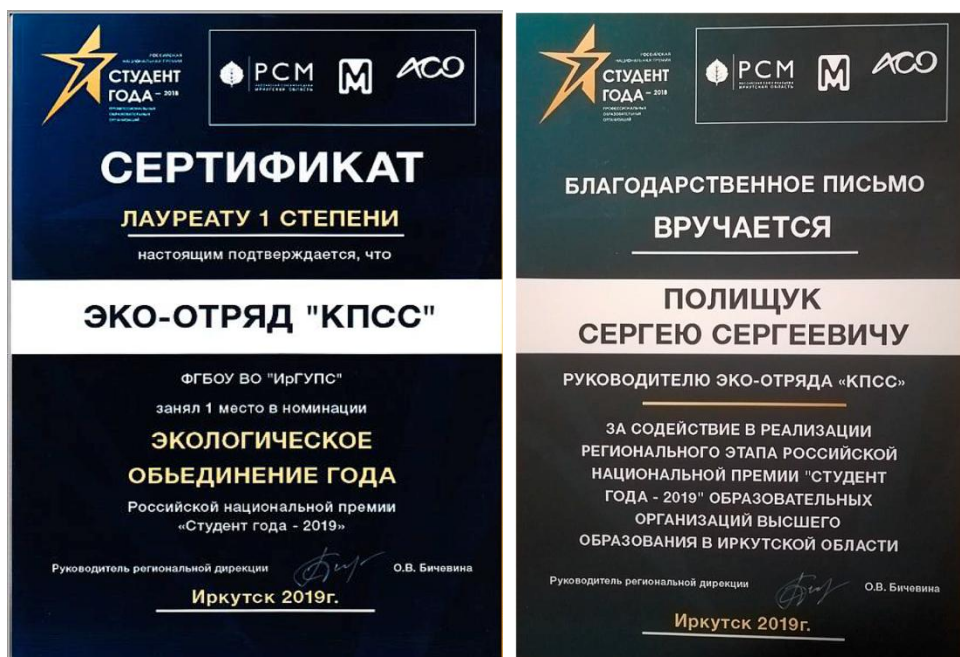
Рис. 8. Сертификат и благодарственное письмо за участие в премии «Студент года – 2019»