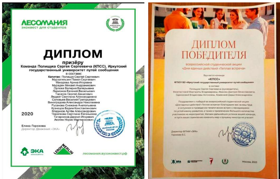
Рис. 6. Дипломы, полученные экоотрядом «КПСС» за участие в квестах и Днях единых действий от АЗВР в разные годы