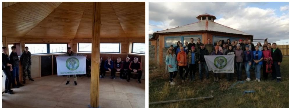
Рис. 3. Экоюрта в д. Харанцы на о. Ольхон как пример использования экотехнологий. Посещение юрты волонтерами БФ ППЖ

лянных бутылок для возведения стен строительных конструкций. При этом опыт оказался успешным, в ней не жарко летом и относительно не холодно зимой без подогрева.