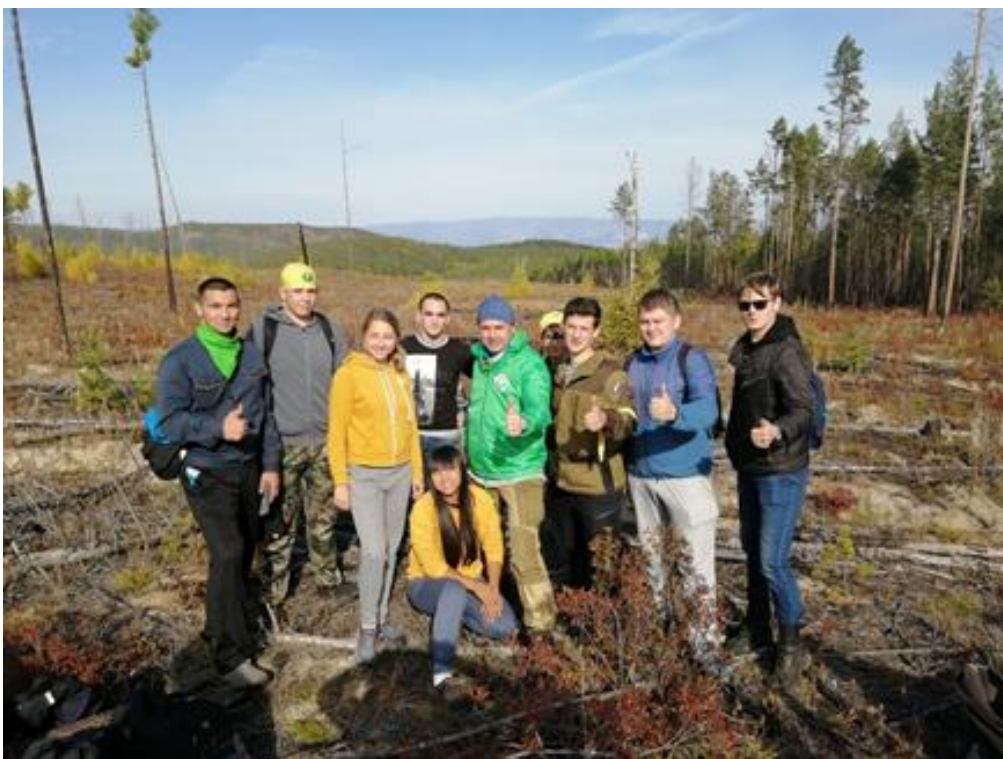
Рис. 2. Участники мероприятия по посадке саженцев на Ольхоне в 2015–2016 гг. и участок восстанавливаемого леса

Саженцы высаживались на месте сгоревшего леса. Как показали дальнейшие исследования его восстановленных участков, выживаемость посаженных сеянцев составила более 90 %.