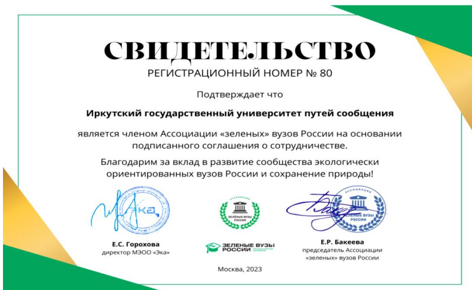
Рис. 4. Свидетельство о вступлении экоотряда «КПСС» в АЗВР (2019 г.) и обновленное свидетельство (2023 г.)