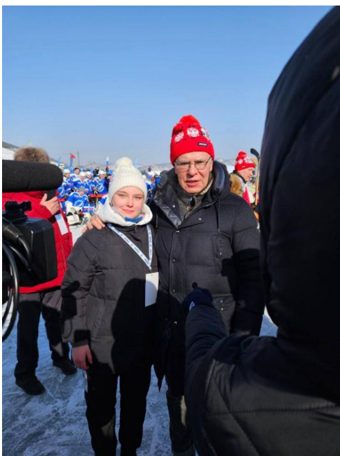
Рис. 17. Активистка экоотряда Д. А. Хомякова с В. А. Фетисовым

(2003). Полковник в отставке. В настоящее время В. А. Фетисов является послом доброй воли России в ООН, председателем Центрального совета Всероссийского общества охраны природы (ВООП). Благодаря такой его должности представителям экоотряда выпадает уникальная возможность периодически встречаться с ним в Иркутске или на Байкале (рис. 17). Как в 2023 г., так и 23 февраля 2024 г. волонтеры экоотряда «КПСС», а это 20 чел., принимали участие в оказании помощи организаторам в проведении праздничного хоккейного матча «Последняя игра» между командой легенд российского и советского хоккея и сборной командой Иркутской области. Матч проходил на льду Байкала в пос. Большое