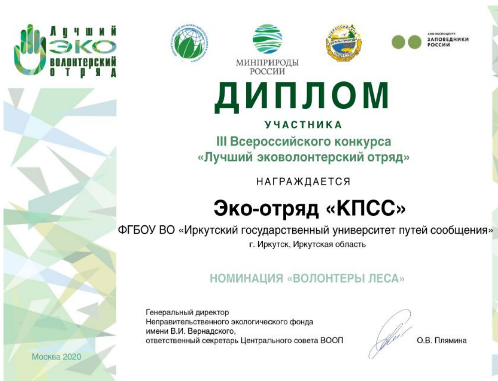
Рис. 13. Диплом и сертификат участника конкурса «Лучший эковолонтерский отряд», полученные в 2020 г.