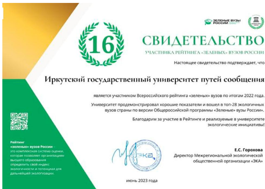
Рис. 5. Свидетельство участника рейтинга АЗВР