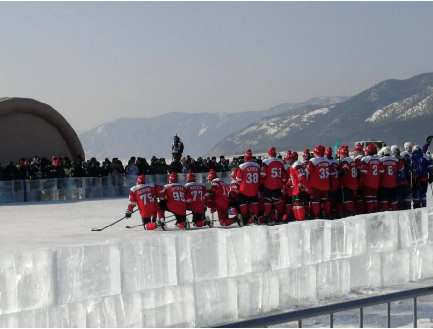
Рис. 18. Хоккейный матч в пос. Большое Голоустное. 23 февраля 2024 г.