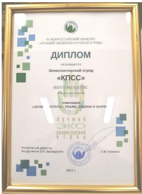
Рис. 14. Проект «Чистая Бугульдейка – чистый Байкал», диплом победителя IV Всероссийского конкурса «Лучший эковолонтерский отряд»