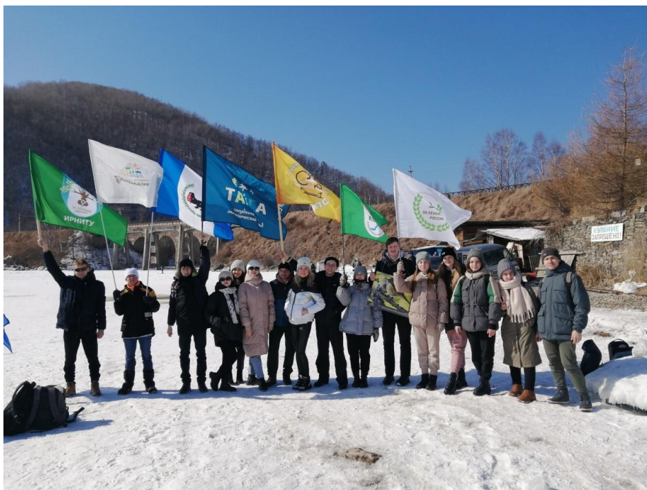
Рис. 16. Ледовый переход через Байкал. 10 марта 2024 г. Ассоциация «ЭкоМолодежь»