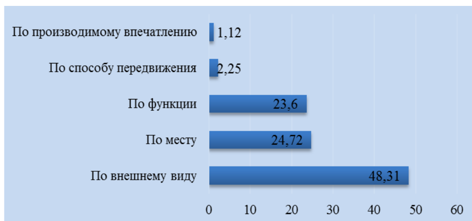
Рис. 2. Основания для сравнения, %

Таким образом, можно сделать вывод, что большинство переводов железнодорожных терминов с русского языка на монгольский сохранили свою метафоричность. В качестве источника метафоризации чаще других используется предметная сфера, наиболее популярной разновидностью метафоры в железнодорожной терминологии является метафора на основании внешнего сходства.