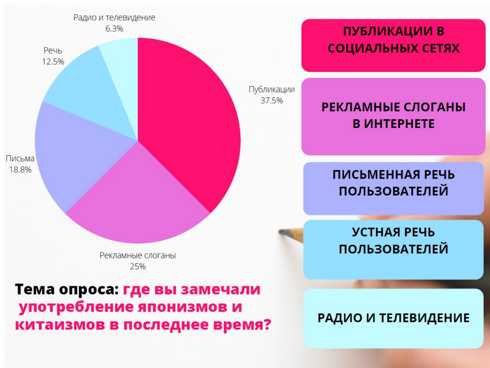
Рис. 1. Сферы распространения японизмов и китаизмов

В социальных сетях в сообществе, которое посвящено восточной культуре и ее особенностям, нами был проведен опрос среди подписчиков (87 чел. в возрасте 20–35 лет). Тема опроса: «Где и как часто Вы замечали употребление японизмов и китаизмов в последнее время?» (рис. 1–2).