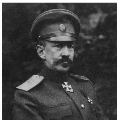
Начальник Штаба Верховного главнокомандующего генерал от кавалерии В. И. Гурко

Результаты наступательной операции у Митавы 23–29 декабря 1916 г. были следующими: русские войска взяли от 800 до 1000 пленных, захватили 18 минометов, 40 пулеметов, много снарядов и снаряжения (в исследованиях упоминается разное число взятых германских артиллерийских орудий – 33, 13, 82). Занятая территория площадью 35 км 2 тактически улучшила позиции русских войск, которые вместо дуги в 14 км заняли хорду в 9 км, продвинувшись вперед на 2–5 км. Станцию Шлок и прилегающие дороги обезопасили от обстрела противника, ранее производившегося с «Языка».