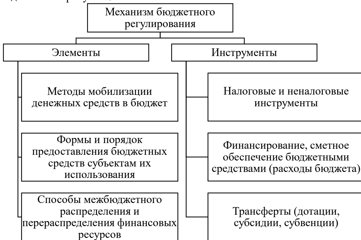
Рисунок 3 – Структура механизма бюджетного регулирования экономики [6]

Согласно такому подходу структуру финансового механизма по назначению в государственном регулировании экономики можно представить в виде схемы – рисунок 3.