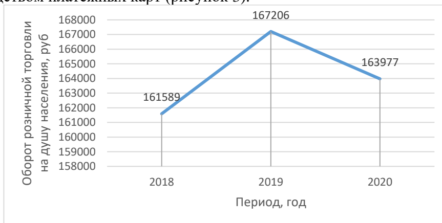
Рисунок 3 – Динамика изменения оборота розничной торговли на душу населения 2018-2020 гг., руб.

Оборот розничной торговли на душу населения – это выручка от продажи товаров населению для личного потребления или использования в домашнем хозяйстве за наличный расчет или оплаченных по кредитным карточкам, расчетным чекам банков, по перечислениям со счетов вкладчиков, по поручению физического лица без открытия счета, посредством платежных карт (рисунок 3).