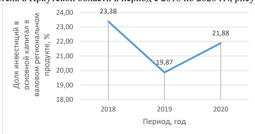
Рисунок 4 – Динамика изменения доли инвестиций в основной капитал в ВРП в Иркутской области 2018-2020 гг., %

Активность инвестиционного обеспечения воспроизводства основного капитала является одним из индикаторов развития экономики региона и отражает процессы финансирования инвестиций в основной капитал. Рассмотрим, как изменялся данный показатель в Иркутской области в период с 2018 по 2020 гг., рисунок 4.