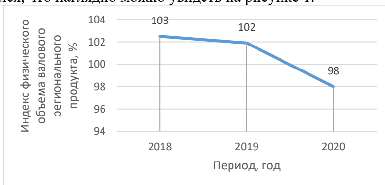
Рисунок 1 – Динамика изменения индекса физического объема ВРП Иркутской области в 2018-2020 гг., в %

Относительный показатель индекс физического объема регионального продукта характеризует изменение текущего объема валового регионального продукта (ВРП) в сравнении с базисным периодом, то есть характеризует физическое изменение ВРП. Значения индикатора в 2018 и 2019 годах удовлетворяют критерию порогового значения, что нельзя сказать о 2020 г. На протяжении трех лет индекс физического объема ВРП снижался, что наглядно можно увидеть на рисунке 1.