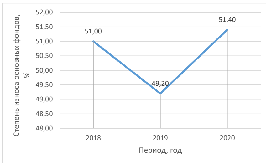
Рисунок 5 – Динамика изменения степени износа основных фондов в Иркутской области 2018-2020 гг., %

В 2019 году степень износа основных фондов снизилась и составила -3,53%, в 2020 году можно увидеть увеличение степени износа, прирост 4,47%. При этом на протяжении трех лет значения были ниже пороговых значений.