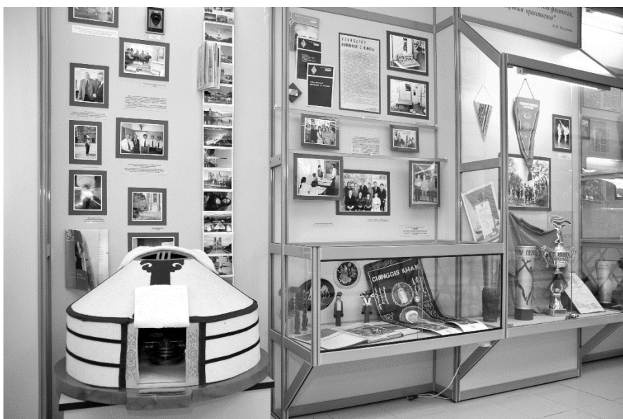
Рис. 6. Экспозиционно-выставочный кабинет ИрГУПС

Сегодня музей истории ИрГУПС существует в новом статусе – экспозиционно-выставочного кабинета. Экспозиция повествует о вехах развития университета, различных аспектах его деятельности, хранит память о людях, внесших огромный вклад в историю становления и развития Иркутского государственного университета путей сообщения. Таким образом, история создания и развития музея ИрГУПС – это история энтузиазма, упорства и уважения к традициям. Благодаря усилиям многих людей он стал важным культурным центром, сохраняющим память о прошлом университета и открывающим двери в его будущее.