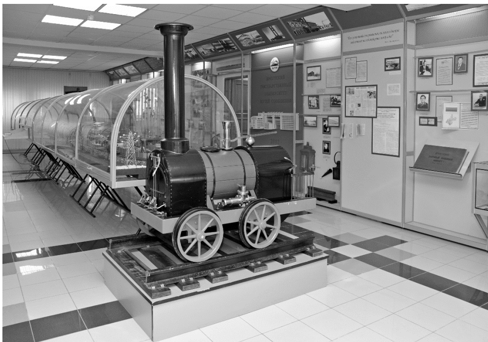
Рис. 3. Экспозиция музея ИрГУПС

Экспозиция знакомит посетителей музея с ключевыми вехами развития вуза, его достижениями и традициями. Большой раздел экспозиции посвящен выпускникам, так как именно они создают репутацию учебного заведения. Студенты подолгу задерживаются у стенда, рассказывающего о ветеранах войны, работавших в ИрИИТ. Он содержит уникальные экспонаты, переданные из личных коллекций. Как и ожидалось, самыми любимыми экспонатами стали макеты железной дороги и паровоза Черепановых.