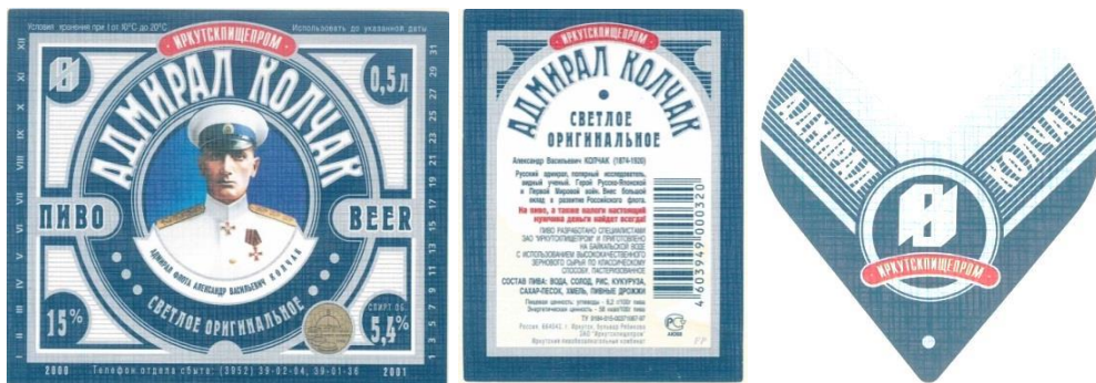
Рис. 12. Фронт-этикетка, контр-этикетка и кольеретка (2000–2001 гг.)

В том же временном промежутке появляются этикетки, сохранявшие свой внешний вид до конца существования Иркутскпищепрома. Портрет Колчака, обрамленный кругом с очень широким ободом, заключается в прямоугольник с полосатым задником. Сам портрет остается прежним. С фронт-этикеткой меняется и контр-этикетка, и кольеретка (рис. 12, 13).