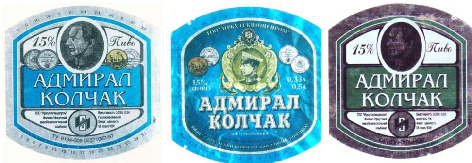
Рис. 4. Этикетки с указанием технических условий (1997 г.)

Далее к сине-серебристому варианту были добавлены еще две медали, и появился «подвид» пива – «Оригинальное» зелено-серебристого цвета. Также был вариант с добавлением с помощью современных технологий фуражки к портрету адмирала. Если присмотреться, сразу видна ее «фотошопность». ТУ датированы 1997 г. (рис. 4).