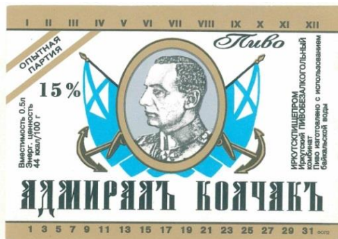
Рис. 2. Этикетка опытной партии

Первый вариант этикетки этого пива с текстом «Опытная партия» имел вытянутую прямоугольную форму; на нем был представлен овал портрета адмирала в профиль, взятый с его официального фотопортрета 1919 г. [4]. Окружали овал Андреевские флаги и два якоря. Общий цвет этикетки бело-золотистый. Интересной особенностью было то, что информация о пиве и производителе располагалась вертикально снизу вверх (рис. 2).