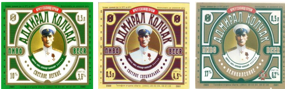
Рис. 13. Варианты фронт-этикеток (2000–2001 гг.)