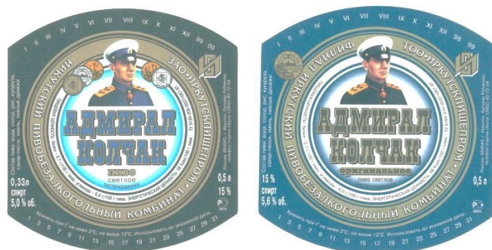
Рис. 5. Одиночные фронт-этикетки (1998–1999 гг.)

Изображение адмирала изменилось – был взят его фотопортрет в форме времен Гражданской войны. Его можно увидеть на приказах верховного правителя [4]. Правда, китель стал черным, а на погонах появились невразумительные птички. Видимо, издержки печати. На этикетке портрет заключен в круг, с медалями с обеих сторон и надписями по периметру круга. На части этикеток завод еще поименован товариществом, на части «Иркутскпищепром» стал закрытым акционерным обществом. Появилось изображение знака соответствия при обязательной сертификации продукции в РФ.