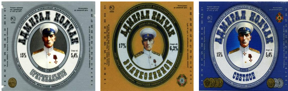
Рис. 11. Фронт-этикетки (2000–2001 гг.)

В том же временном промежутке появляются этикетки, сохранявшие свой внешний вид до конца существования Иркутскпищепрома. Портрет Колчака, обрамленный кругом с очень широким ободом, заключается в прямоугольник с полосатым задником. Сам портрет остается прежним. С фронт-этикеткой меняется и контр-этикетка, и кольеретка (рис. 12, 13).