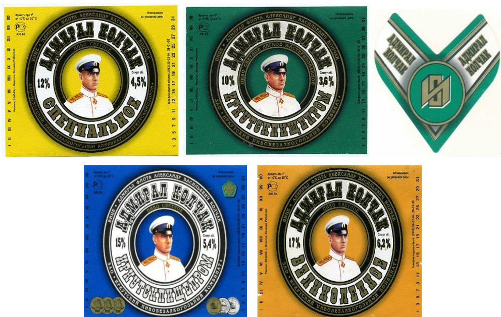
Рис. 10. Фронт-этикетки и кольеретка (1999–2000 гг.)

В том же временном промежутке, в 1999–2000 гг., внешний вид этикеток снова изменился (рис. 10). Портрет Колчака, мундир которого стал белым, а на погоны вернулись орлы, снова заключили в круг с очень широким ободом, в нижней части которого появилась крупная надпись «Иркутскпищепром» либо название варианта напитка. Добавился вариант «Великолепное». Изменился внешний вид кольеретки, контр-этикетка же осталось прежней, окрашенной в «приборные» цвета.