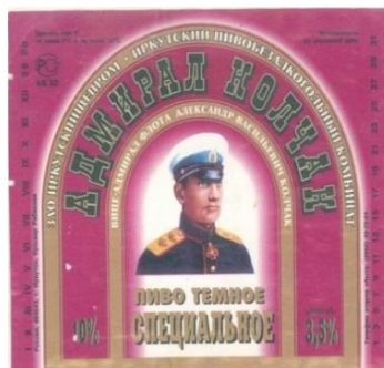
Рис. 9. Фронт-этикетка с аркой красного цвета (1998–1999 гг.)

У синего «Светлого», «Оригинального» и «Специального» имелись подвиды, различавшиеся объемом спирта в напитке (см. рис. 8). У «Специального» с объемом спирта 3,5 % фон арки стал красного цвета (рис. 9).