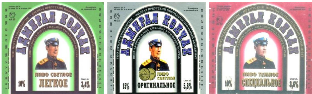
Рис. 8. Фронт-этикетки (1998–1999 гг.)

У синего «Светлого», «Оригинального» и «Специального» имелись подвиды, различавшиеся объемом спирта в напитке (см. рис. 8). У «Специального» с объемом спирта 3,5 % фон арки стал красного цвета (рис. 9).