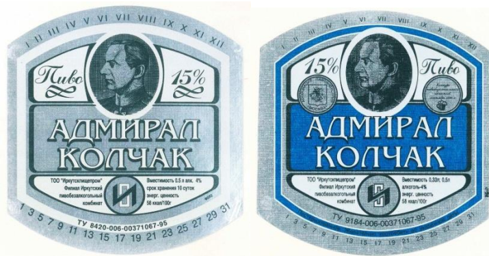
Рис. 3. Этикетки с указанием технических условий (1995 г.)

Позже были выпущены этикетки, отпечатанные на фольгированной бумаге в форме прямоугольника с выпуклыми горизонтальными гранями. Портрет Колчака остался тем же, выходные данные стали печататься привычно, слева направо, появилось обозначение технических условий выпуска 1995 г. Цветовая гамма – блестящий и вороненый металл. Существовал вариант с добавлением в палитру синего, зеленого цветов и наград конкурсов (рис. 3).