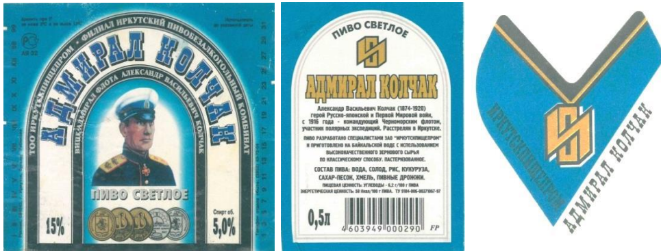
Рис. 7. Фронт-этикетка, контр-этикетка и кольеретка (1998–1999 гг.)

На этикетках второго типа портрет сохранен таким же, но уже обрамлен аркой белого цвета. На контр-этикетку, наконец, вынесли краткую биографию адмирала (рис. 7). Вариантов пива стало больше – добавилось «Легкое». Этикетки с датой «99 00» сохранили тип «арка», появился лишь вариант «Специальное» (рис. 8).