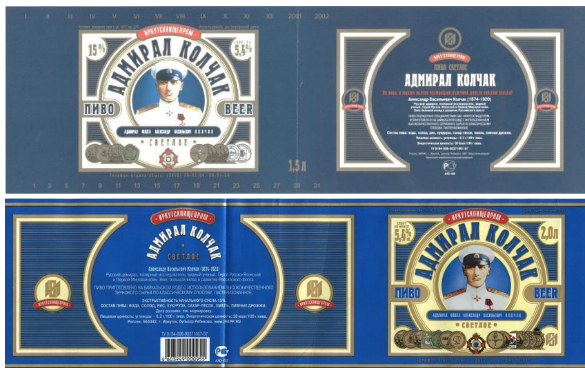
Рис. 15. Варианты этикеток-лент

Стоит отметить, что пиво «Адмирал Колчак светлое» объемом 1,5 и 2 литра несло этикетки-ленты с изображением последнего варианта. Ленты имели бумажное и пленочное исполнение (рис. 15).