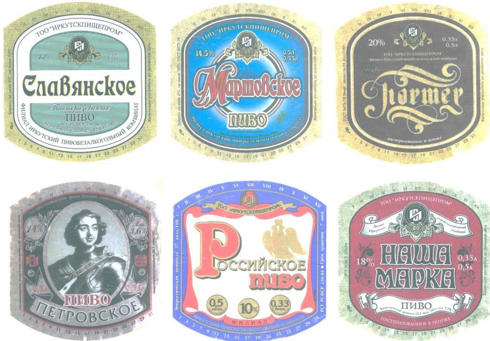
Рис. 1. Примеры этикеток общероссийских сортов пива

На заре своего существования Иркутскпищепром выпускал марки пива, оставшиеся со времен СССР. Они имели названия, соответствующие общей номенклатуре марок пива, выпускавшихся в Советском Союзе: «Петровское», «Российское», «Двойное золотое», «Праздничное», «Юбилейное», «Исетское», «Мартовское», «Наша марка», «Славянское» (рис. 1). На этикетках стояли ГОСТы времен советской власти.