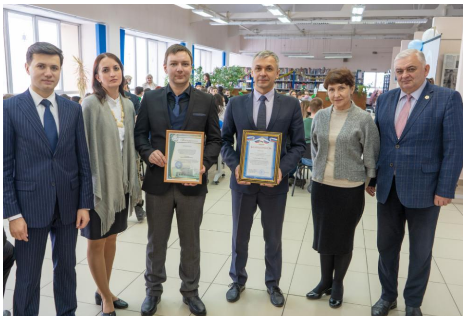
Рис. 9. Антинаркотический брейн-ринг среди вузов Иркутска. 2021 г.

Еще одним важным направлением нашей работы является сотрудничество с ЦОМП и МП ВСЖД для адаптации студентов целевого набора (рис. 10) и молодых специалистов – выпускников университета к работе на предприятиях. Это взаимодействие позволяет более эффективно осуществлять программы стажировок и практик, что, в свою очередь, содействует лучшей интеграции студентов в профессиональную среду.