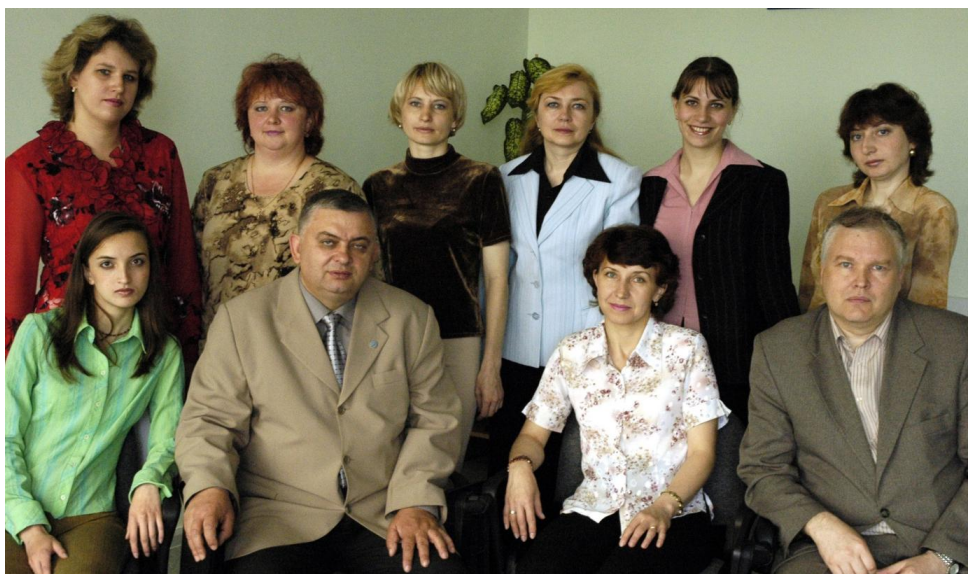
Рис. 7. Участники семинара с психологами ВСЖД. 2005 г.

Центр активно поддерживает инициативы преподавателей и студентов, что создает атмосферу открытости и готовности к реализации новых идей. Сотрудники ЦРЧК всегда готовы выслушать предложения и помочь в их воплощении.