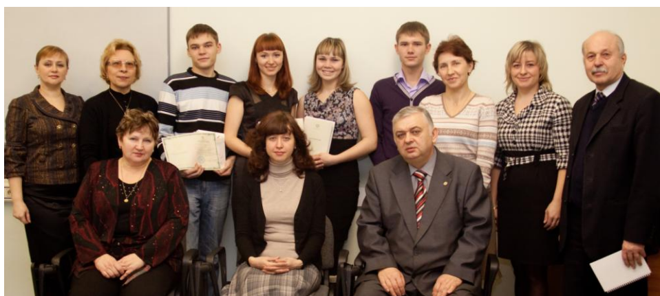
Рис. 10. Студенты-целевики после успешной защиты дипломов и члены комиссии

Еще одним важным направлением нашей работы является сотрудничество с ЦОМП и МП ВСЖД для адаптации студентов целевого набора (рис. 10) и молодых специалистов – выпускников университета к работе на предприятиях. Это взаимодействие позволяет более эффективно осуществлять программы стажировок и практик, что, в свою очередь, содействует лучшей интеграции студентов в профессиональную среду.