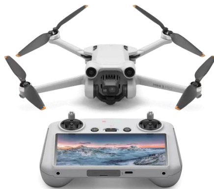
Рис. 1. Квадрокоптер DJI Mini 3 Pro

Необходимость в усовершенствовании БПЛА связана с конструктивными особенностями используемых в ОАО «РЖД» аппаратов. На рисунке 1 представлен один из БПЛА, который применяется для видеоконтроля в период выполнения ремонтных работ на железнодорожном пути.