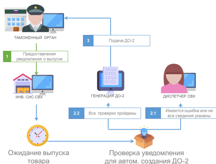
Рис. 2. Схема автоматического создания и подачи отчета ДО-2

Приведенная на рисунке 2 схема может быть дополнена еще одним этапом, которые дополнительно делает сверку сведений в отчете ДО-1 о сведения в уведомлении о выпуске (количество товара, стоимость, вес, код ТНВЭД и количество мест). Если при сверке с ДО-1 выявлены расхождения, то система создает и отправляет в таможенный орган коммерческий акт. Далее информационная система СВХ ожидает регистрацию коммерческого акта и после этого генерирует отчет ДО-2. Если во время отправки происходит сбой или из информационной системы таможенных органов не приходит за отведенное время подтверждение получения, то информационная система СВХ уведомляет об этом диспетчера СВХ.