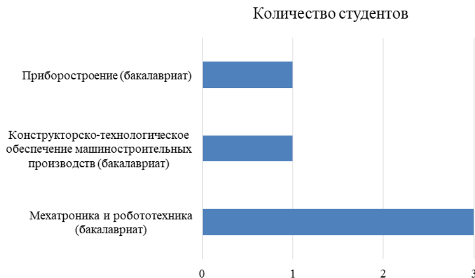
Рис. 1. Распределение студентов с ОВЗ по направлениям подготовки факультета «Транспортные системы»

Воспитательная работа со студентами-инвалидами на факультете «Транспортные системы» направлена на создание условий для их успешной адаптации, самореализации, а также на формирование у них позитивного отношения к себе, к сокурсникам, к своим возможностям. Студенты с ОВЗ в большинстве случаев находятся в группах с обучающимися, которые не имеют форм и степеней ограничений жизнедеятельности, поэтому в большинстве случаев просят не афишировать свое состояние инвалидности. Перечень направлений, на которых обучается данная категория студентов, представлен на рис. 1.