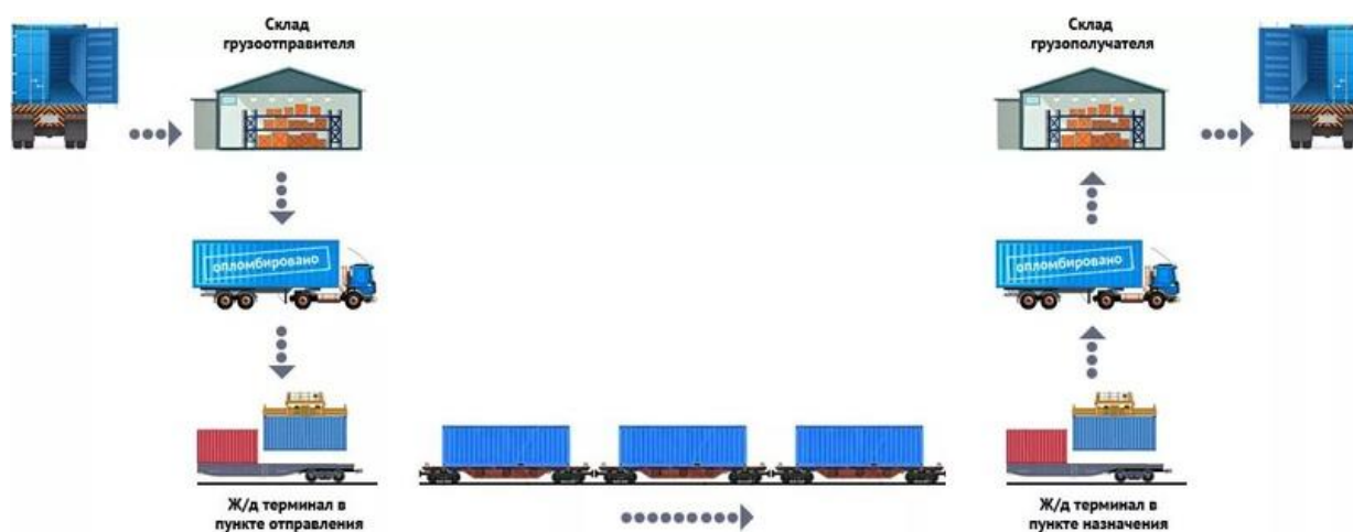
Рис. 1. Схема контейнерной перевозки

Схема контейнерной перевозки представлена на рисунке 1.