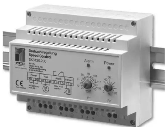
Рис. 1. Регулятор оборотов вентилятора RITTAL SK3120.200

Управление оборотами вентиляторов в аналогичных компьютерных стойках поездных диспетчеров Восточно-Сибирской железной дороги осуществляется регулятором Rittal SK3120.200, представленной на рисунке 1 [3].