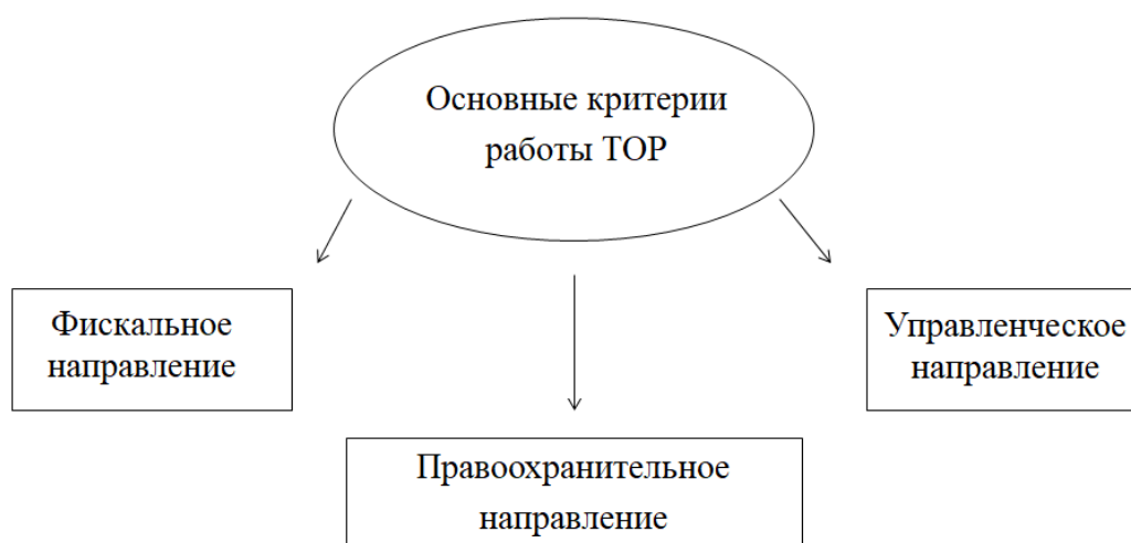
Рисунок 1 – Основные критерии оценивания работы таможенных органов

Однако для соблюдения вышеуказанных условий ФТС и региональным таможенным органам необходима полномасштабная и объективная картина действительности в отношении показателей эффективности. Для этого каждый общий критерий работы детализируются на более узкое представление, что можно заметить в приказе ФТС России от 30.10.2017 № 1720 «Об утверждении показателей результативности и эффективности деятельности ФТС России, территориальных таможенных органов и Центрального аппарата ФТС России»[4].