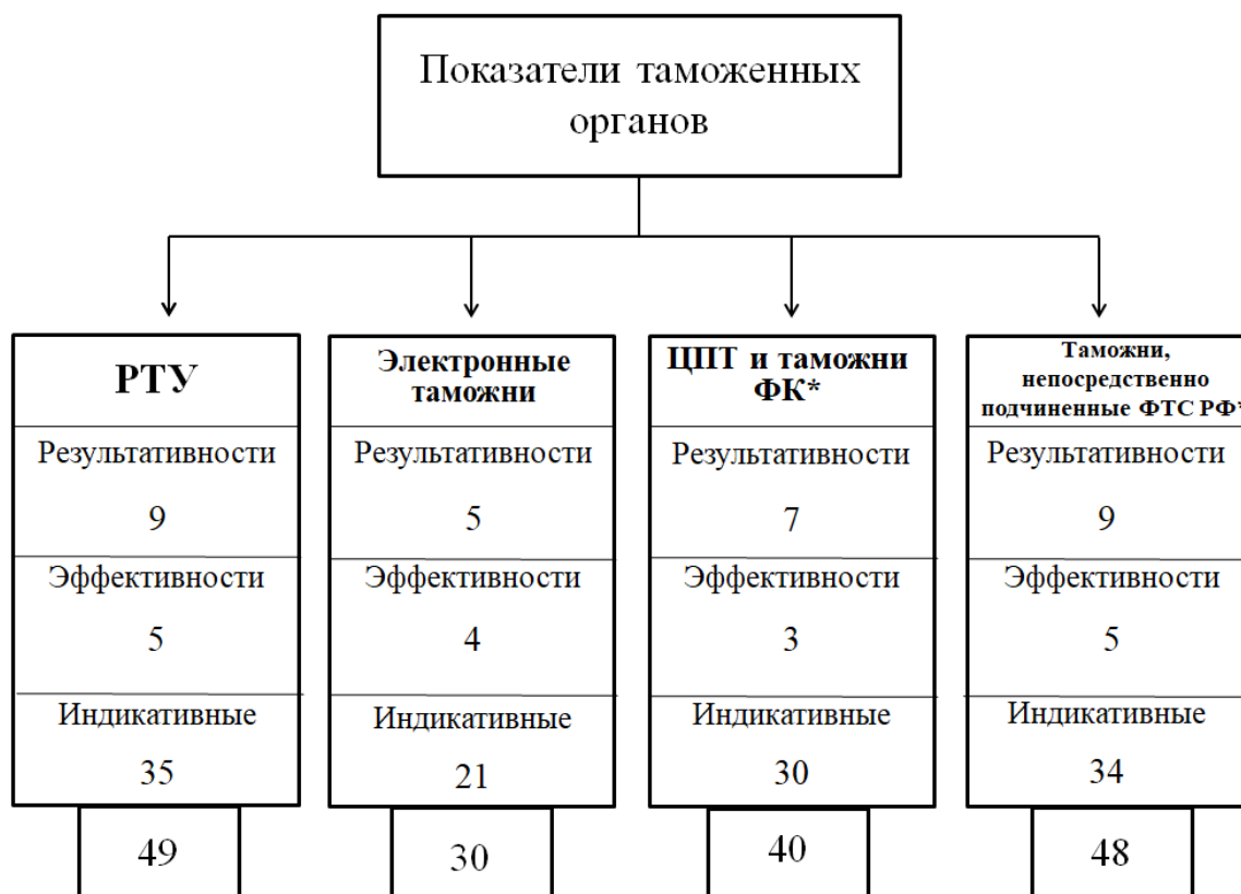
Рисунок 2 – Показатели таможенных управлений и таможен на основании положений из приказов ФТС №76 и №1080

К показателям деятельности таможенных органах относятся три группы: показатели результативности и эффективности, а также индикативные показатели. Рассмотрим отдельно каждый показатель в соответствии с системой таможенных органов на основании двух нормативных актов [5,6]: