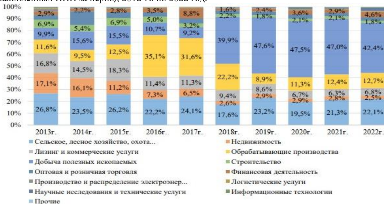
Рисунок 2 - Отраслевая структура накопленных ПИИ из Китая в Россию в 2013-2022 гг.

Китайская компания HENAN Si&C планируют построить завод, который будет производить карбид кремния. Он будет расположен в Воронежской области, где находятся самые крупные месторождения кварцевого песка, который находится здесь без каких-либо примесей [17]. В этот проект планируется вложить более 3 млрд. долларов. Готовая продукция будет доставляться непосредственно в сам Китай и в рядом расположенные государства Юго-Восточной Азии. На рисунке 1 представлена общая отраслевая структура накопленных ПИИ за период 2012-го по 2022 год.