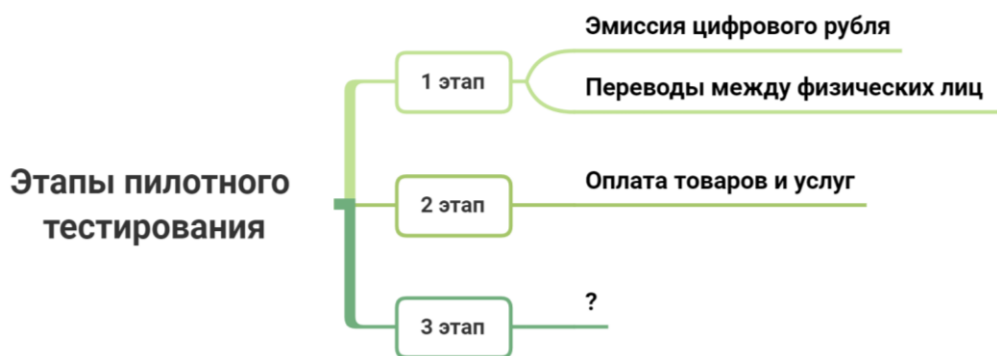
Рис. 2. Этапы пилотного тестирования

Пилотная группа сообщила о первых переводах между физическими лицами. Сбербанк сообщил что выполняет организационно-технические мероприятия по подключению к платформе ЦБ и дорабатывает свои программные комплексы, сообщил представитель банка, уточнив, что уже созданы и проведены первые тестовые запросы внутри платформы цифрового рубля ЦБ. Также хочется отметить, что у Сбербанком и Банком России разошлись мнения в перспективах использования цифрового рубля, так, например, Сбербанк против того, что единственным эмитентом был Банк России, ведь это означает, что коммерческие банки не смогут увеличивать свои актива за счет кредитования, также Сбербанк отметил, что это приведет к дефициту ликвидности и как следствие к росту ставок [4, 15].