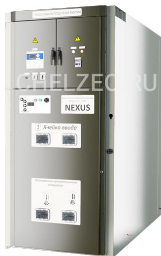
Рис. 3. Внешний вид ячейки КРУ- 35 кВ