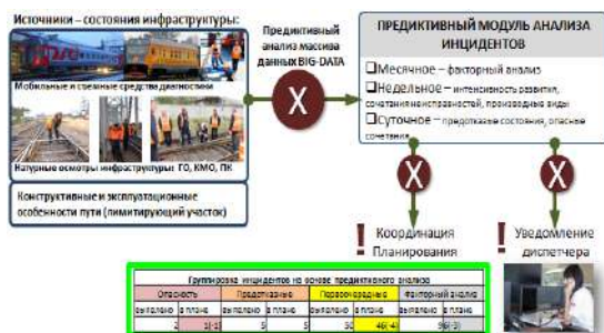
Рис. 2. Планирование путевых работ на основе предиктивного анализа

анализ. Также необходимо определить наиболее эффективные варианты решений из классификатора соответствия вида работ – устраняемой неисправности, учесть конструктивные и эксплуатационные параметры и выбрать наиболее оптимальный вариант, основываясь на моделировании ожидаемых результатов с учетом экономической составляющей производства путевых работ.